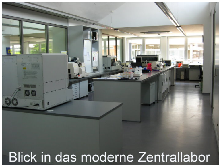
Blick in das moderne Zentrallabor

Zur Verbesserung der Wirtschaftlichkeit, Stärkung der Leistungsfähigkeit, zum Ausbau der Leistungsangebote sowie zur Vernetzung der Krankenhausleistungen mit Vorsorge- und Rehaeinrichtungen, Alten- und Pflegeheimen und Ambulanten Pflegediensten, schlossen sich die Krankenhäuser Wilhelm-Anton-Hospital gGmbH Goch, St.-Antonius-Hospital gGmbH Kleve, St.-Nikolaus-Hospital gGmbH Kalkar und Marienhospital gGmbH Kevelaer am 01.01.2003 zum Verbund der Katholischen Kliniken im Kreis Kleve zusammen. Unter dem Dach der Katholischen Kliniken im Kreis Kleve Trägergesellschaft mbH Kleve , mit einem Aufsichtsrat und einer Geschäftsführung für alle Einrichtungen, werden heute vier Krankenhäuser, fünf Alteneinrichtungen, ein Mutter-Kind-Kurhaus, zwei Ambulante Pflegedienste, zwei Service-Gesellschaften, Ausbildungsstätten für Kranken- und Kinderkrankenpflege, ein modernes Zentrallabor mit Blutbank sowie eine Krankenhausvollapotheke betrieben.